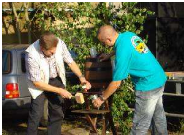
Der Bürgermeister beim Freibieranstich