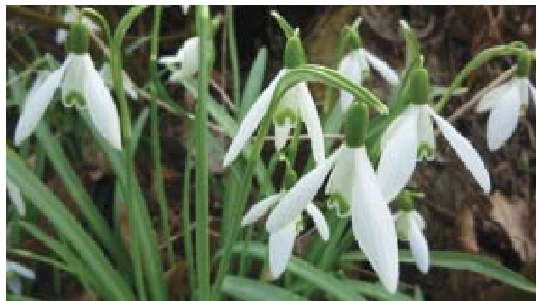
Schneeglöckchen am Rosenbach

In diesem Gemeindeblatt erfahren Sie unter anderem: