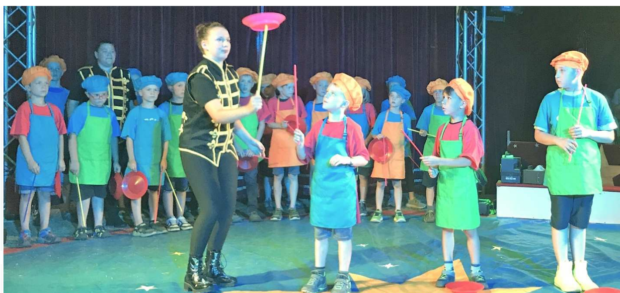
Großer Auftritt der Kinder aus dem Hort „Gernegroß“ im Zirkus „Aron“

Nach umfangreichen Instandsetzungsarbeiten läuft das Wasser am neuen Rastplatz wieder. Herzlichen Dank der Familie Hertrampf für die Unterstützung.