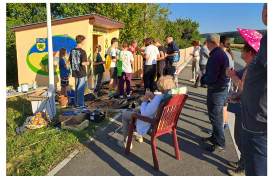
Große Anteilnahme der Bevölkerung

Bei Beratungen im Gemeinderat zu diesem Thema wurde deutlich: Eine Veränderung in diesem Bereich liegt nicht im Ermessen der Gemeinde Rosenbach. Der Bürgermeister hat sich in der Vergangenheit oftmals um Verbesserungen bemüht, die leider bisher nicht gefruchtet haben.