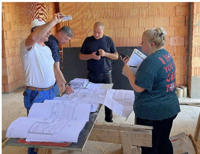
Bauberatung mit der Baufirma Pursche und dem Planungsbüro aT2 - architektur – TRAGWERK mehnert | GEORGI