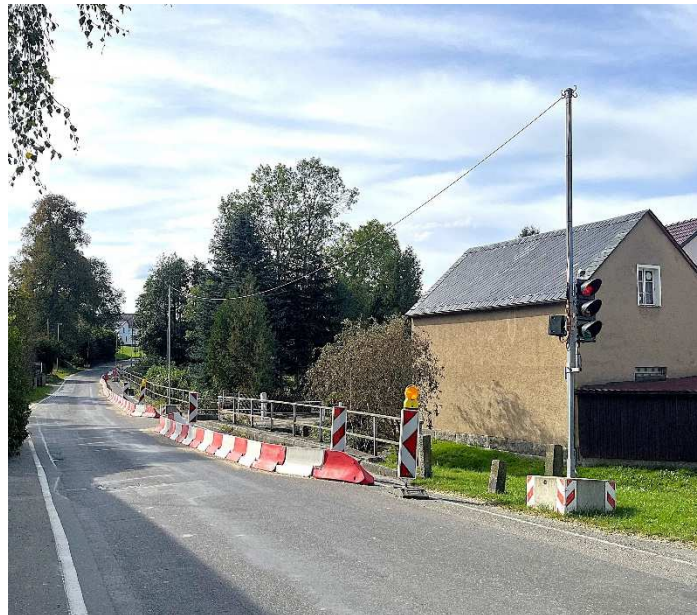
Straßeneinengung an der maroden Stützmauer