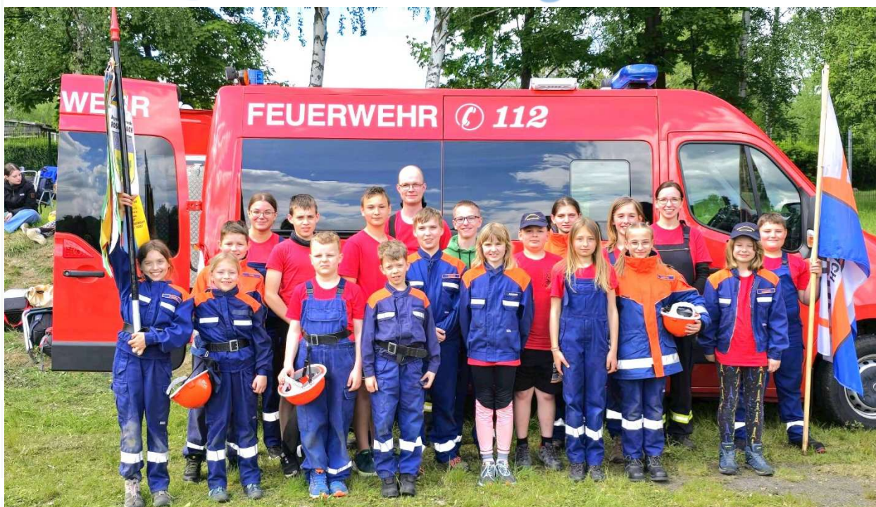
Schauvorführung der Jugendfeuerwehr zum 28. Depotfest in Bischdorf