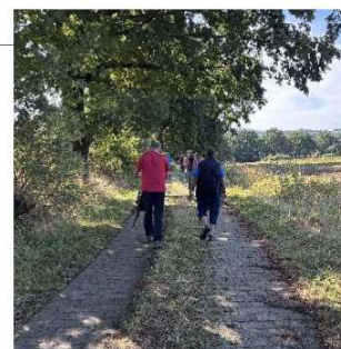
1.Etappe KGB-Pilgerweg