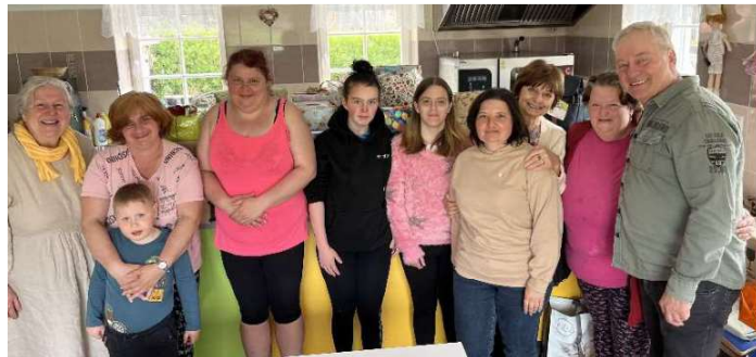
Übergabe der Osterpäckchen 2025